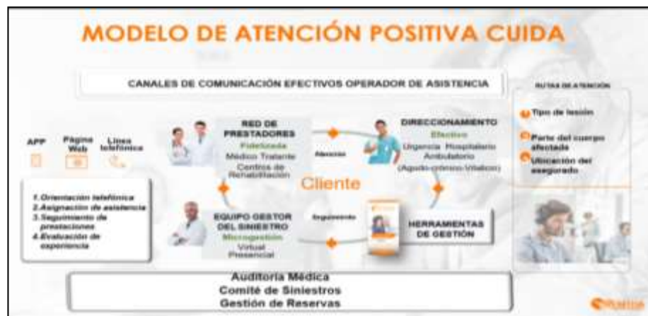
Figura 1. Modelo de Atención Positiva Cuida 2021

El modelo de atención es dinámico, se establece y formula de acuerdo con las necesidades del cliente, las coberturas o amparos concertados con el tomador del seguro.