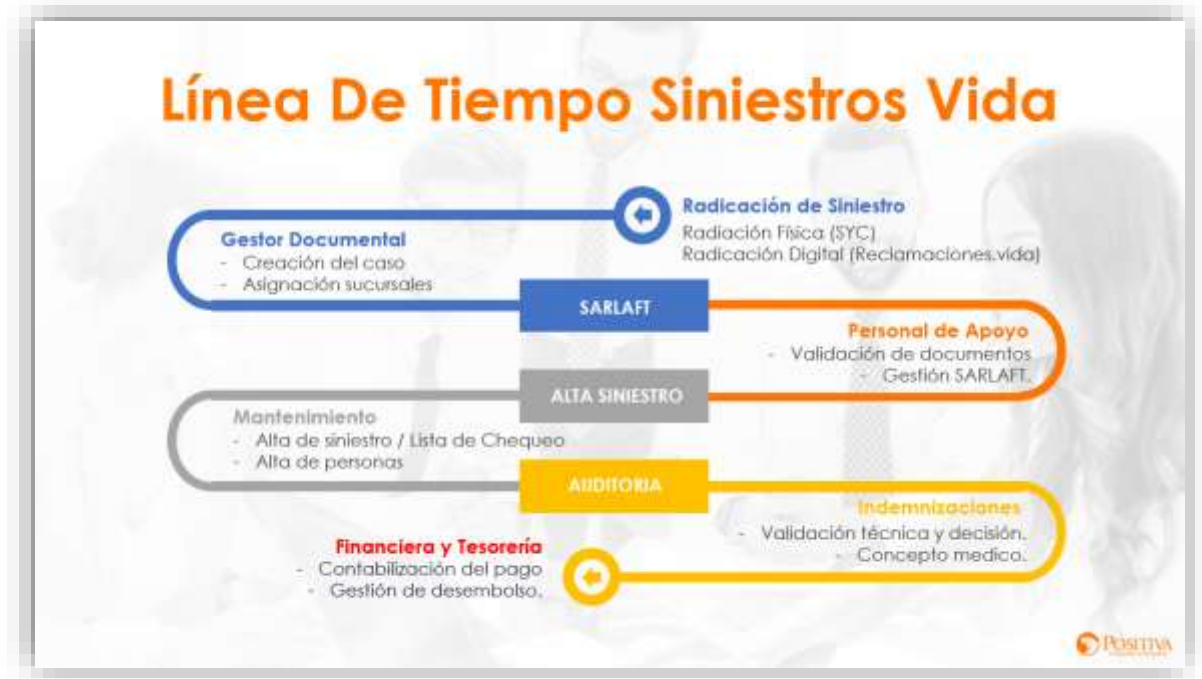
Figura 2. Ciclo Gestión de Siniestros de Seguros de Vida

Sub procesos que conforman el proceso de Gestión de Siniestros