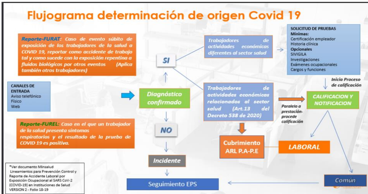
Gráfico 1. flujograma de contingencia COVID-19

A continuación, se expone el flujograma definido para la determinación de origen preferencial de los casos COVID-19: